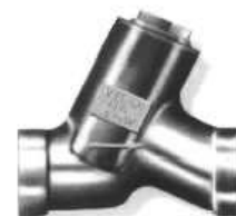
PISTÃO CORPO EM "Y" TAMPA SOLDADA Classes de pressão ASME 1690 - 4500, 1/2 - 4" (15-100 mm)