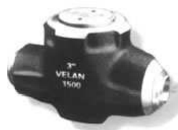
PISTÃO OU PORTINHOLA SELADO POR PRESSÃO Classes de pressão ASME 6000 - 2500, 2 - 24" (50-600 mm) Classes de pressão ASME 4500, 2 - 12" (50-300 mm)