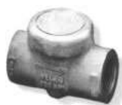
PISTÃO COM TAMPA SOLDADA Classes de pressão ASME 150 - 1500, 1/2 - 2" (15-50 mm) PORTINHOLA JEM TAMPA Classes de pressão ASME 800, 1/2 - 2" (15-50 mm)