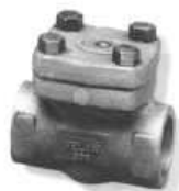
TAMPA APARAFUSADA PORTINHOLA, PISTÃO, ESFERA Classes de pressão ASME 150 - 1500, 1/4 - 24" (8-600 mm)